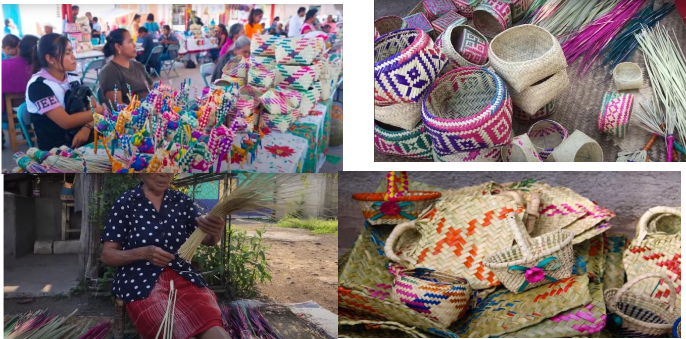
Figura 2. Tipos de Artesanías de Palma

familiares. Dentro de estas actividades económicas destaca para la presente investigación la elaboración de artesanías a partir de la palma, las cuales desempeñan un papel significativo de identidad en esta comunidad, donde se ha transmitido esta técnica tradicional de trenzado o tejido de generación en generación. En este entorno, se producen diversos productos de palma, como tanates, petates, aventadores, canastas, escobetas, juguetes, entre otros; los cuales poseen un valor simbólico importante ver figura 2. Esta actividad no solo contribuye como fuente de ingresos principal o secundaria para las familias locales, sino que también representa una tradición arraigada en la comunidad.