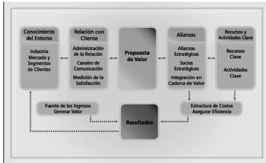
Figura 1. Modelo nacional para las mipymes competitivas

Nota: la imagen muestra que, para promover la viabilidad y competitividad de las mipymes, es necesario que estas conozcan el entorno, la administración de la relación con los clientes, la definición de una propuesta de valor, la generación de alianzas, la gestión de recursos, así como el control de las fuentes de ingresos y su estructura de costos.